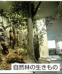
自然林の生きもの